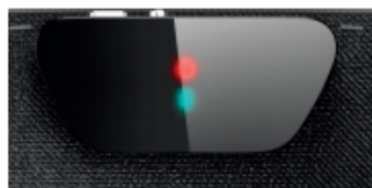
(赤 LED ライト: 充電不足)

残りの電池残量は、[FUNC] ボタンを押した時の電源 LED ライトの色で確認できます。