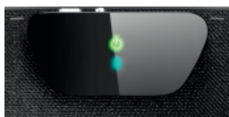
(緑の LED ライト: 充電済)